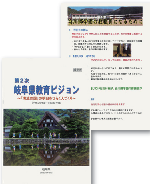
大きな画像も、オルフィスのお陰でキレイに印刷されるので、見栄えが良いです！

授業を子どもたちに分かりやすく伝えるため、教材は毎日かせません。理科と社会は写真や図表を拡大プリントしたものを使用した授業が多く、毎回拡大プリンターを使用するとコストが掛かってしまうのですが、ORPHISで分割印刷した物を貼りあわせて使用することで、コストを抑えつつ分かりやすい授業を行えています。以前は印刷物に合わせて何種類もプリンターを使い分けていましたが、今はほぼ全てORPHIS1台でまかなえています！お陰で管理しやすくなり、村への報告も簡単になりました。